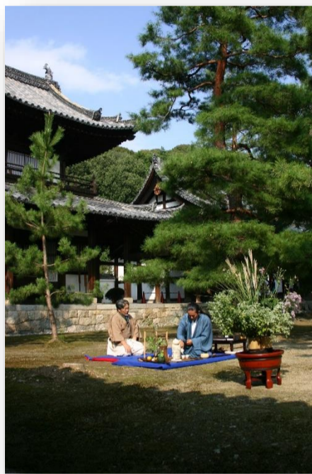
萬福寺の野点(京都府)